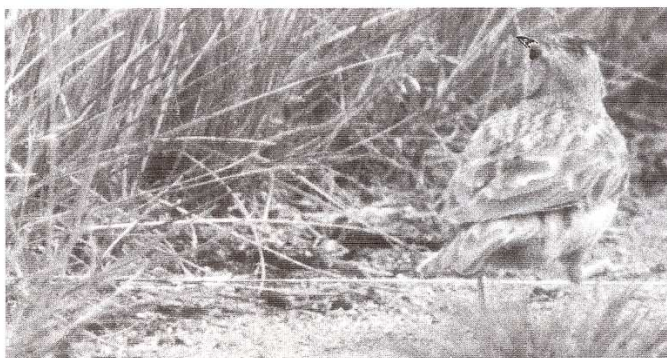
Juli 1996

1 Haubenlerche, aufgenommen in Wildeshausen (Oldenburg), inzwischen eine Rarität in Nordwest-Deutschland. Der Schnabel ist nachgezogen.