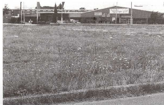
3/4 Brutplatz der Haubenlerche auf einem krautigen Grünland am westlichen Rand des Gewerbegebietes Wildeshausen (Oldenburg), Juli 1996