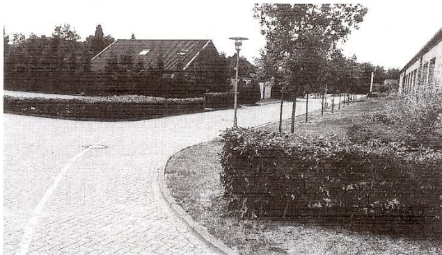
6 Ehemaliger, heute versiegelter und verbuschter Brutplatz am Graf-Friedrich-Gymnasium Diepholz

gering. BRINKMANN sah am 24. März 1914 Hunderte an der Landstraße bei Querum (Braunschweig) in Gemeinschaft mit Feldlerchen, das war wohl eine Ausnahmebeobachtung.